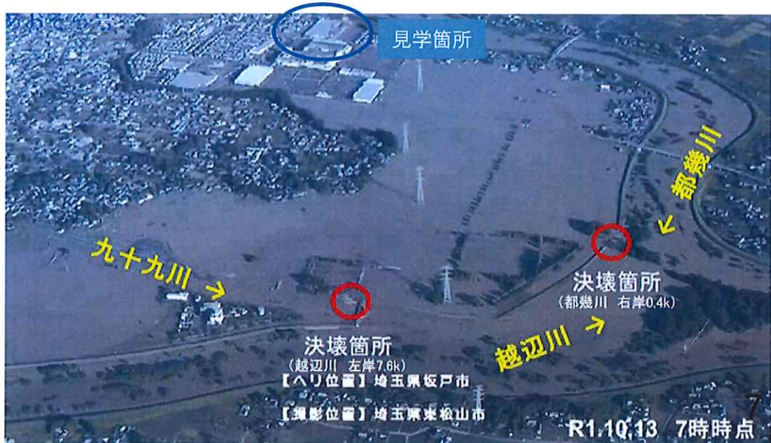
現場近隣の被災状況

令和元年台風19号において甚大な被害が発生した荒川水系入間川流域における今後の治水対策の中の堤防整備の工事のひとつとして行われている工事が「R2都幾川あずま町築堤工事」です。